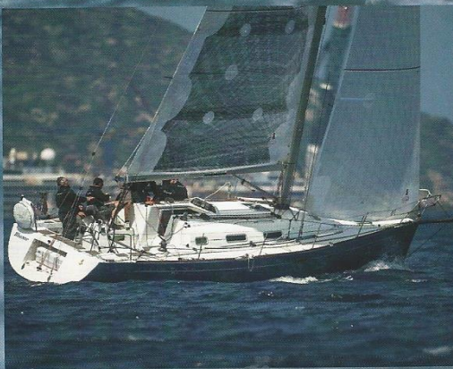
PRIMO CLASSIFICATO CLASSE 4 BLUONE, SERVI LEONARDO, FIRST 36.7